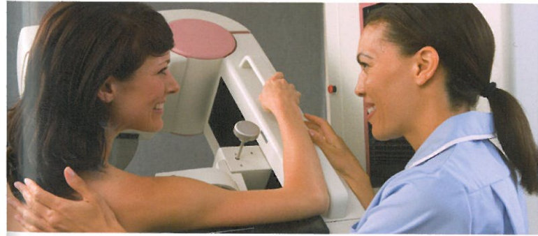
Las mamografías son habitualmente tan innecesarias como peligrosas