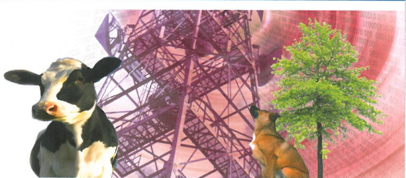
Constatado: las radiaciones electromagnéticas afectan también a plantas y animales